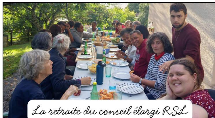
La retraite du conseil élargi RSL

Nous constatons que le Seigneur nous envoie un peu moins de monde depuis cet été, comme si nous avions besoin d'un temps de repos, d'aller chercher plus en profondeur et d'enraciner davantage notre foi en Dieu. Peut-être aussi le besoin de retravailler nos structures intérieures avant de nous remettre en route. Nous constatons que le Seigneur nous envoie un peu moins de monde depuis cet été, com-